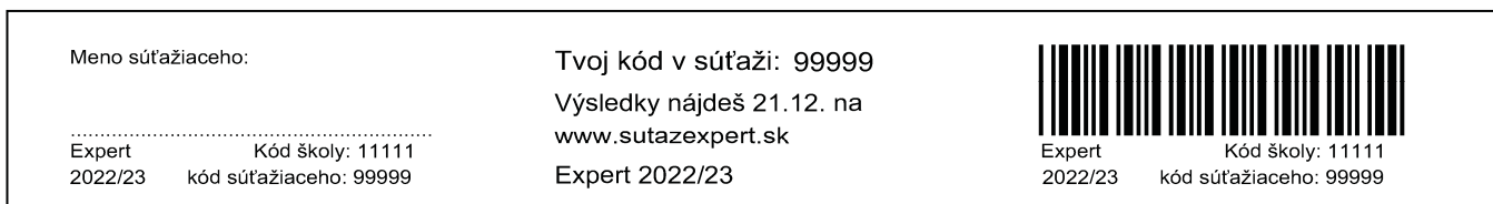
obr. 2 – vzor štítku žiaka prihláseného školou