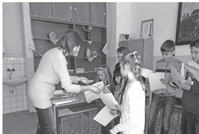
Experti zo Základnej školy s MŠ v Hrachove.