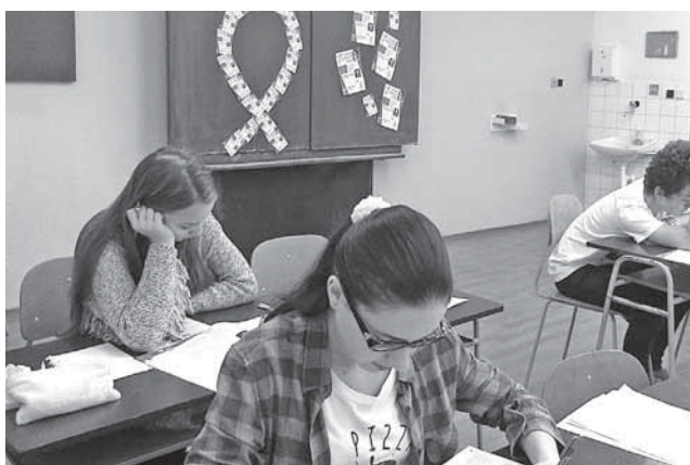
Žiakov zo Základnej školy Mateja Lechkého v Košiciach čakala takto vyzdobená učebňa.